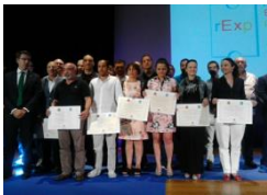
O presidente da Xunta, Alberto Núñez Feijoo, entregou os certificados de profesionalidade de Información Xuvenil da súa IIIª Convocatoria